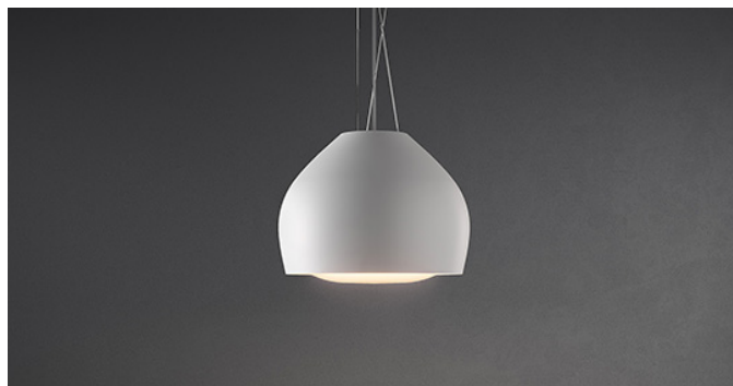
Снимката е само за информация Може да не отговаря на избрания модел